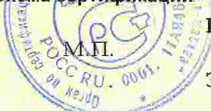
Схема сертификации - 3.

Место нанесения знака соответствия - на товарном ярлыке, рядом с товарным знаком изготовителя. Форма и размеры знака по ГОСТ Р 50460-92.